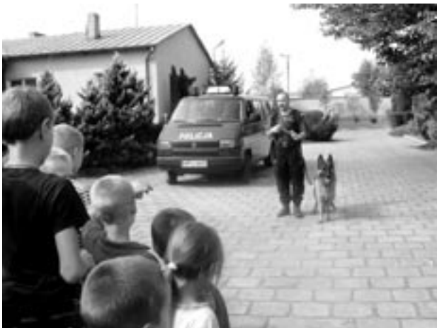
Przyborowo – Szkoła Podstawowa