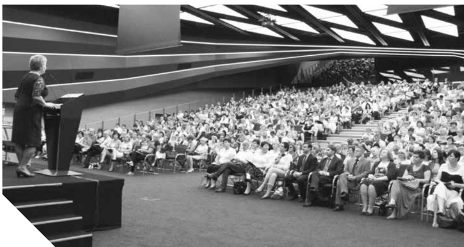
Konferencja dla dyrektorów szkół w Sali Ziemi na terenie Międzynarodowych Targów w Poznaniu.

Jubileusz funkcjonowania naszej instytucji jest okazją zarówno do retrospekcji, jak i sformułowania wizji jej przyszłości. Przekształcenia organizacyjne pokazują ewolucję myślenia o zadaniach oświatowych i obligują nas też dziś do dotrzymywania kroku aktualnym potrzebom edukacyjnym.