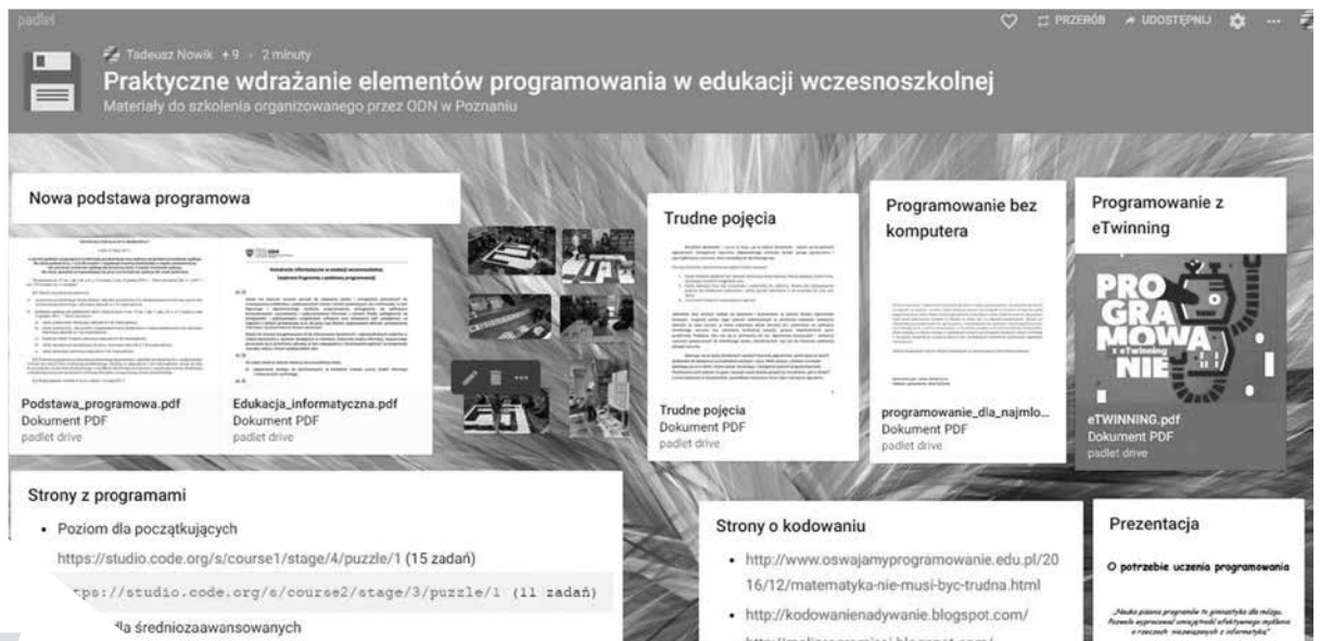
Przykład wykorzystania wirtualnej tablicy.

Gdy stawiamy uczniom problem i chcemy w szybki sposób zebrać proponowane rozwiązania, a następnie je wspólnie przedyskutować, to Padlet świetnie się sprawdzi w takiej sytuacji burzy mózgów. Po kilku minutach na tablicy znajdzie się kilkanaście wypowiedzi uczniów.