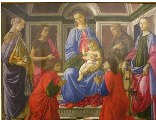
Sandro Botticelli, Madonna z Dzieciątkiem i świętymi