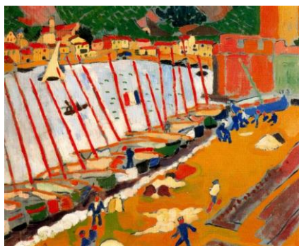
Andre Derain, Port rybacki w Collioure