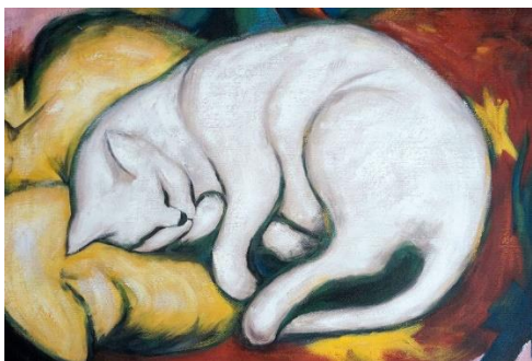
Franz Marc, Biały kot